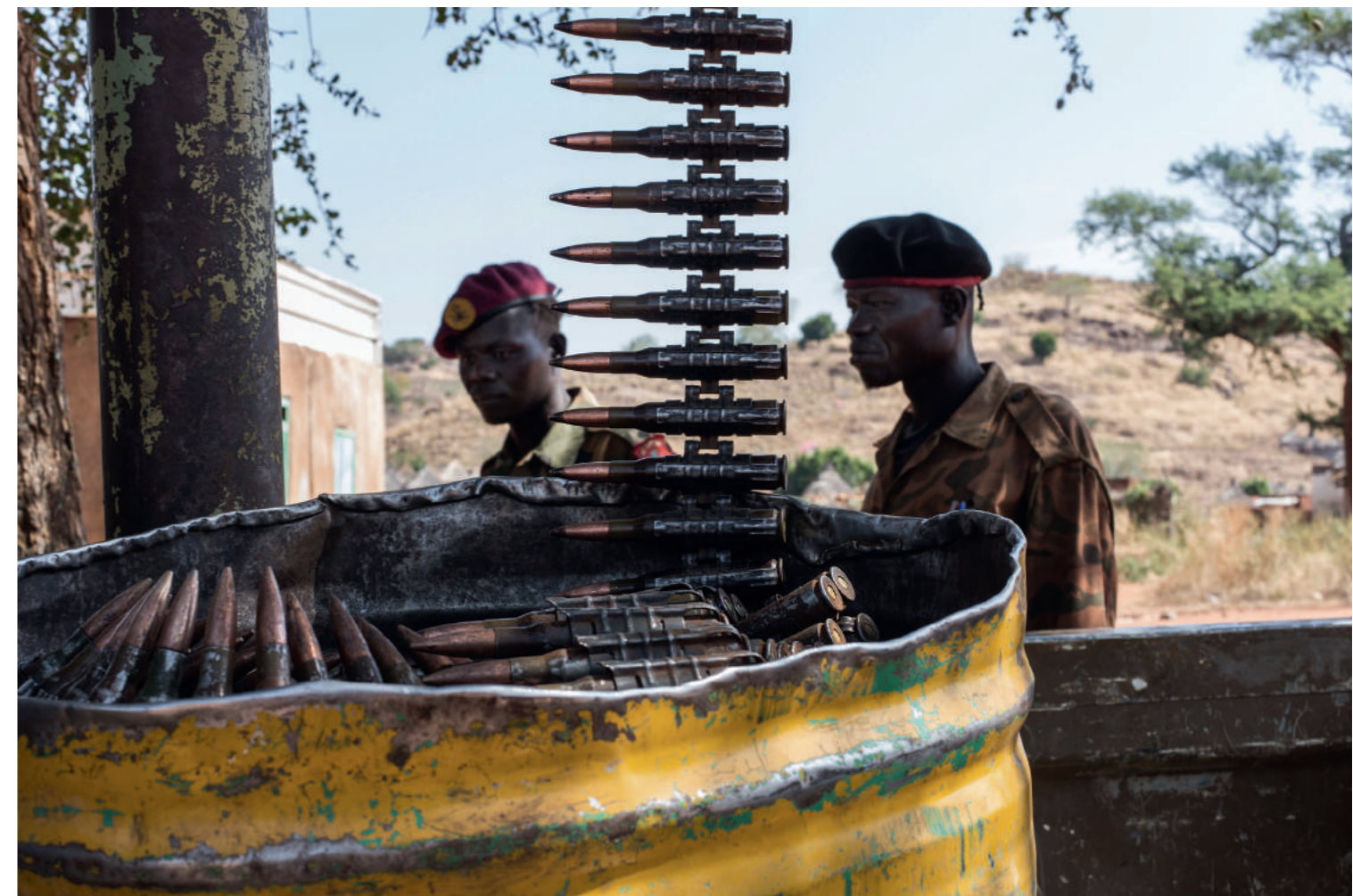
Kordofan du Sud Soudan, 16 nov. 2012