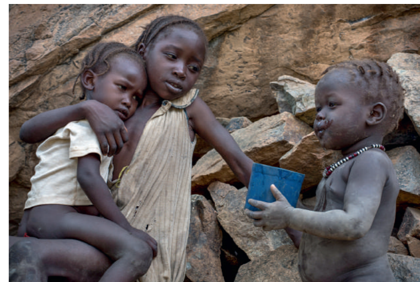
Sud Soudan