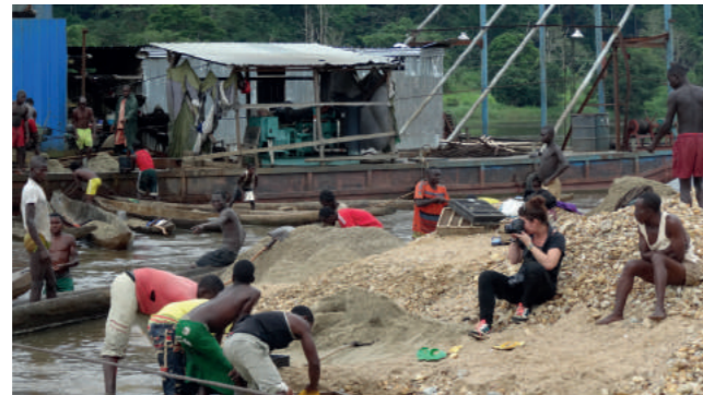
© Jonathan Pedneault - Portrait Camille Lepage RCA 2014