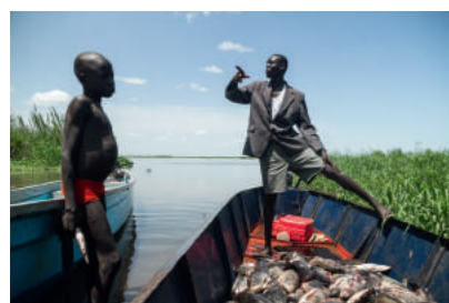
© Camille Lepage - Sud Soudan

Elle est surtout partie avec sa détermination indestructible d'aller s'installer dans des pays en conflit dont les médias ne parlaient pas suffisamment à son goût et de témoigner.